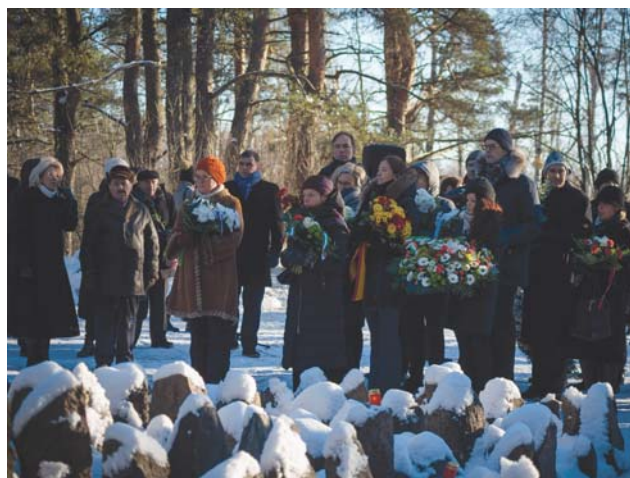
הנחת זרים ברומבולה ע"י הסגל הדיפלומטי Возложение венков на церемонии в Румбуле

די ביה"ס היהודי ע"ש דובנוב ובני הקהילה היהודית. "זהו יום טראגי בתולדות לטביה. אנו זוכרים את אלפי יהודים שנרצחו כאן ע"י הגרמנים ומשתפי פעולה הלטיביים", – ציין שר החוץ אדגר רינקביץ'.