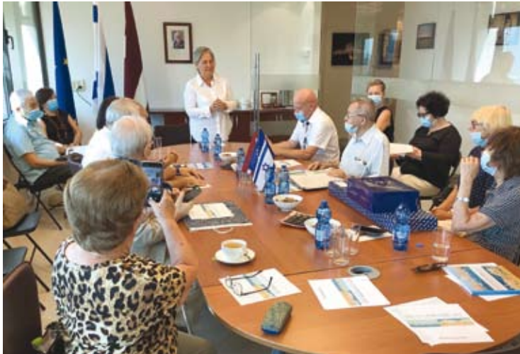
השקת הספר השני בשגרירות לטביה

Презентация второй книги в посольстве Латвии