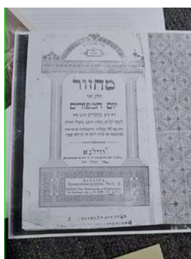
ספר התפילה של סבי