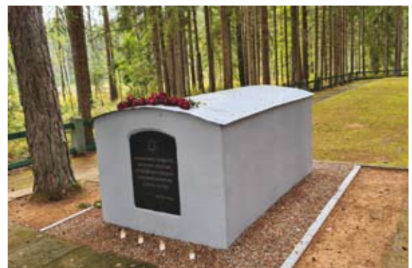
אנדרטה באתר הרצח של יהודי עיירה Balvy. האתר סודר בעזרת תרומות של ישראלים – צאצאי הנרצחים Место расстрела евреев Балвы. Приведено в порядок на средства, собранные в Израиле потомками жертв