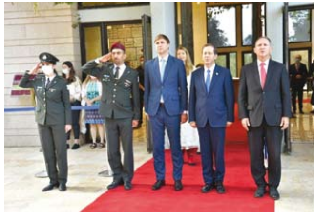
שגרירה של אסטוניה בטקס במשכן הנשיא Посол Эстонии (в центре) на церемонии в резиденции президента Израиля

Вейкко Кала родился в 1981 г. в Тарту. В 2005 году он начал работать в Министерстве иностранных дел и занимал различные должности, в том числе в посольстве Эстонии в Вене, и был заместителем главы Эстонской миссии в Москве. С 2019 по 2021 год он был советником премьер-министра по внешней политике, после чего приступил к исполнению обязанностей посла в Израиле.