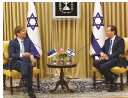
דנים בתאום דרכי שת"פ אפשרי Посол и президент обсуждают возможные сферы сотрудничества

בשיחה לאחר הטקס הדגישו השגריר והנשיא את חשיבות הרחבת השירותים הדיגיטליים במגזר הציבורי בנושא בעל עניין ותועלת הדדית. הם ציינו כי הגברת שיתוף הפעולה בתחום זה יועיל לשני הצדדים. מגפת COVID-19 פגעה בפיתוח היחסים בין המדינות; עם זאת, היא גם סיפקה הזדמנויות לחיפוש דשנות והאיצה את פיתוחם וקליטתם של פתרונות דיגיטליים שונים, כולל במערכת החינוך. אסטוניה מוכנה לחלוק את הני-