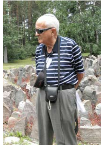
ברומבולה, קיץ 2011 В Румбуле летом 2011 г.