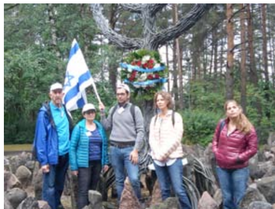
משתתפי קבוצת "שורשים וזיכרון" באתר ההנחה רומבולי גруппа по программе «Корни и Память» 2018 г. в Румбуле

בעשרים השנים האחרונות ארגנו 9 סיורי "שורשים וזיכרון" בלטביה ואסטוניה. כל פעם יצאו בין 25 ל-35 המשתתפים, רובם ילידי הארץ, שהוריהם עלו בשנות ה-30 ו-40. תמיד מרגש לראות ולשמוע את הצברים הקשוחים שעומדים ליד בית המשפחה בריגה, דווינסק, לודזה, טאלסי, רזקנה ונזכרים בסיפורים של ההורים על העבר של המשפחה או הקהילה. בטקסים ברומבולה וליד שרידי בית הכנ