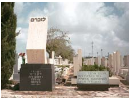
אנדרטה בבית העלמין בחולון Памятник на кладбище в Холоне

לזכור קורבנות השואה. על אלו פגישות נערכו בקירוב 400 איש מכל המדינה, ויש לנו תמיד שמחה לראות ביניהם ילדים צעירים וצעירים צעירים.