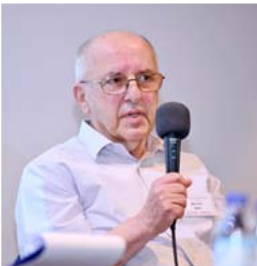
פרופ' בניציון ביילין Проф. Бенцион Бейлин

попытку самосожжения у Памятника Свободы в Риге в 1968 г., вплоть до его алии в начале 1972 года.