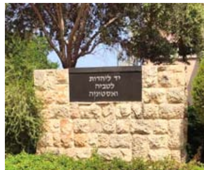
אנדרטה ליד הבניין בשפיים אשר הוקם ע"י האגוד Памятный знак возле здания, построенного Объединением в Шфаим

ב-2011 שנה זו פגישתנו עם הילדים והנכדים שלנו.