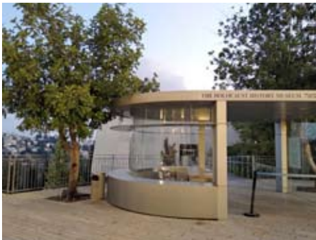
עץ לכבוד ז' ליפקה בכנסה ליד ושם Дерево в честь Ж. Липке у входа в Яд ва-Шем

Почетное звание Хасидей умот ха-олам («праведники народов мира») присваивает институт Катастрофы (Шоа) и героизма Яд ва-Шем представителям других народов, которые в период Катастрофы спасали или содействовали спасению евреев и при этом рисковали своей жизнью. Согласно принятого Кнесетом в 1953 г. закона увековечение имен «праведников» является одной из задач Яд ва-Шем. Тем самым Государство Израиль заявило, что считает своим долгом почитание тех немногих, кто приходил на помощь евреям в обстановке почти всеобщего равнодушия значительной части нееврейского населения оккупированных стран к злодеяниям нацистов, а нередко и прямого соучастия в них. Комиссия по признанию Праведников начала работу в 1963 г. и по 1 января 2021 г. звание Праведника Народов мира было присвоено 27 921 гражданам 51 страны. Работа комиссии продолжается.