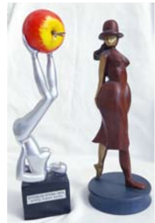
שתי נשים Две женщины