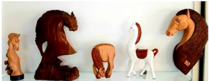
האורווה שלי Моя конюшня