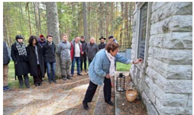
תלמידי ביה"ס ויו"ר הקהילה ליד האנדרטה Ученики еврейской школы и председатель Общины у памятника жертвам