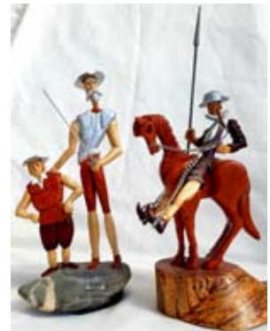
דון קישוט Дон Кихот