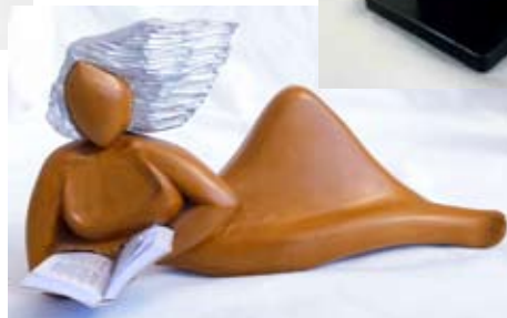
קוראת ספר Читающая книгу