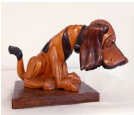
ידידו של האדם Друг человека