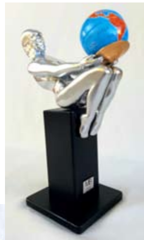
כל העולם בידיו Весь Земной шар