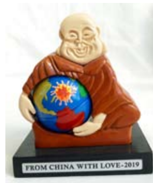
Вирус из Китая - на весь мир