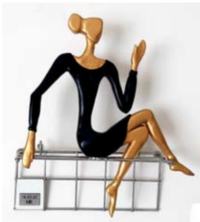
גברת על הספסל Женщина на скамейке