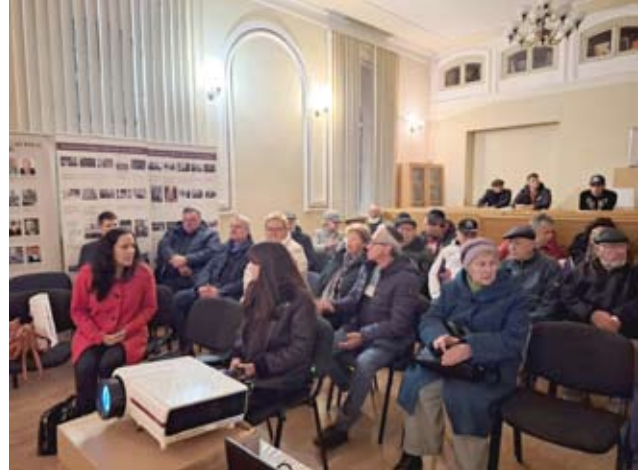
שגרירות ישראל בלטביה שרון רפפורט-פלגי במפגש סולידריות בדאוגבפילס Посол Израиля в Латвии Шарон Раппапорт-Пальги на встрече солидарности в Даугавпилсе