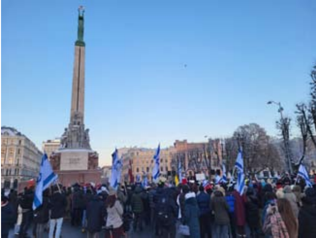
עצרת סולידריות עם ישראל ליד אנדרטת החירות בריגה Митинг солидарности с Израилем у Памятника Свободы в Риге

Проявление солидарности с народом Израиля и его страной в Латвии