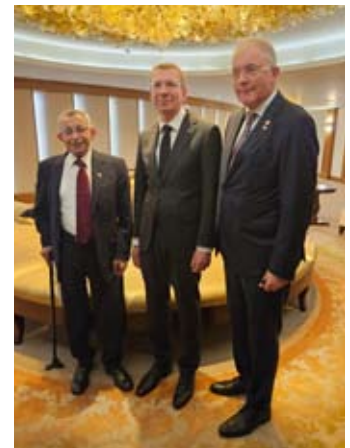
נשיא לטביה א' רינקביץ' הגיע ליש- ראל בביקור סולידריות. הוא נפגש עם משפחות של החטופים, וכן עם יוצאי לטביה בישראל.

מימין לשמאל: שגריר לטביה א' גרו- זה, נשיא לטביה, יו"ר האגודה א' ולק