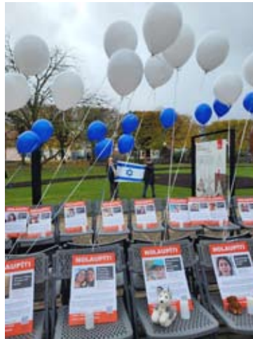
עצרת סולידריות ביורמלה Акция солидарности в Юрмале