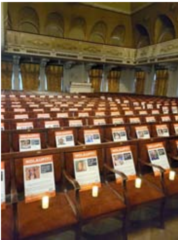
דיוקנאות של בני ערובה באולם הגדול של בית הקהילה היהודית בריגה Портреты заложников в Актовом зале Дома Еврейской Общины в Риге