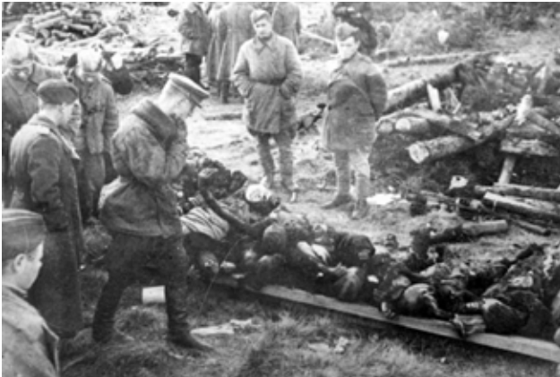
חיילי הצבא האדום ליד אחד מוקדי הרצח במחנה קלוגה Солдаты Советской армии в концлагере Клоога возле одного из мест уничтожения узников

армии в районе Таллинна. За день до этого немцы отдали приказ о выводе своих войск из Эстонии. Во время отступления они решили уничтожить оставшиеся лагеря, так как не было времени эвакуировать их по морю в Штуттгоф.