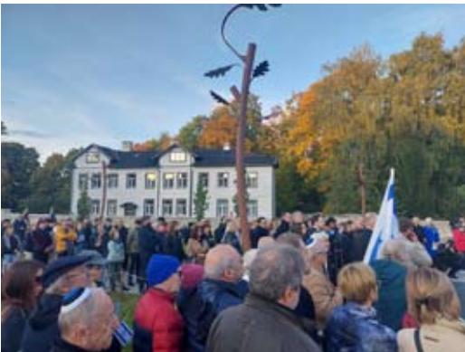
עצרת הזיכרון בטאלין לציון שנה לטבח 7 באוקטובר Мемориальный митинг в Таллинне в память годовщины резни 7 октября

בחודש דצמבר האחרון במוזיאון תל אביב לאמנות נערך קונצרט