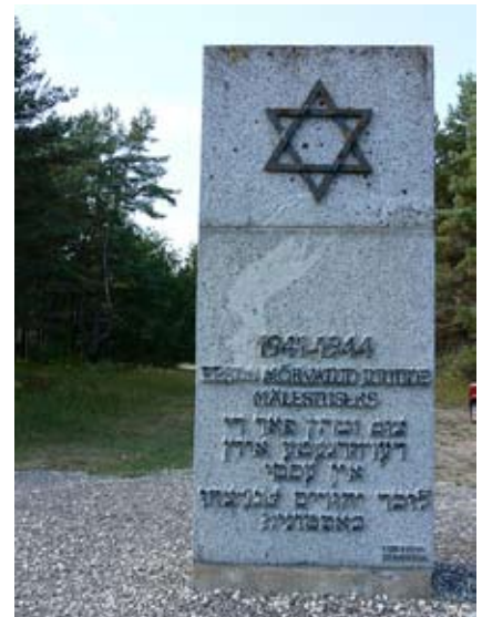
אנדרטת הזיכרון בקלוגה Мемориальный памятник в Клоога

סמוך למוקדים ובשטח המחנה מצאו החיילים הסובייטים הרוסים מסמכים ותצלומים אישיים של האסירים. הם אספו את שמצאו