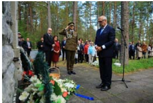
נשיא אסטוניה מר' אלאר קאריס (Alar Karis) בעצרת הזיכרון 19.09.2024 Президент Эстонии г-н Алар Карис на мемориальном митинге в Клоога 19.09.2024

באסטוניה ובישראל נערכו השנה טקסי זיכרון הקשורים לשואה באסטוניה ובהמשך לטבח בשביעי באוקטובר 2023.