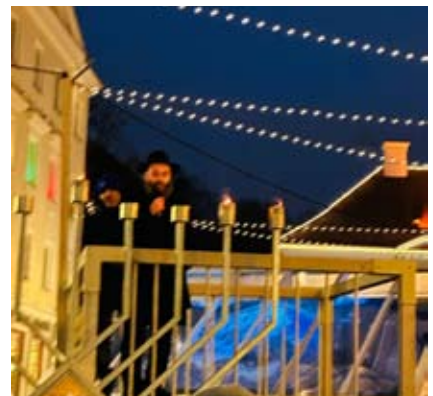
תְּקַסֵּם שֶׁל הַדְּלֻקַּת הַנֵּר הַשֵּׁנִי בְּעִיר טַאֲרֵטוּ בַּהֶש- תַּתְּפוֹת הַרֵב הָרֵאשִׁי לְאֶסְטוֹנִיָּה ר' אֶפְרַיִם שְׁמוּאֵל קוֹט Церемония зажжения второй свечи в Тарту с участием главного раввина Эстонии Эфраима Шмуэля Кота

מִשְׁתַּף שֶׁל הַכֵּנֶר הָאֶסְטוֹנִי הַמְפּוֹרְסָם אֲנִי- רֵס מוֹסְטוֹנ וְהַפְסַנְתָּרן הַיִּשְׂרָאֵלִי גִיל שׁוּחַט. מוֹסְטוֹנ גַּם נִיצַח עַל מִקְהַלֵּת שְׁחַר בַּפֶּס- טִיבֵל אֲבוּ גוֹשׁ לְמוֹסִיקָה קוֹלִית שֶׁהַתְּקִיִּים בְּחֹדֶשׁ אוֹקְטוֹבֵר הָאֲחֵרִין. ב-07.10.2024 נִעְרַכָּה בְּטַאֲלִין עֲצֵרַת הַזִּכִּי- רוֹן לְטִבַּח 7 בְּאוֹקְטוֹבֵר. מוֹסְטוֹנ נִשָּׂא נְאוֹם מִרְגָּשׁ מְאוֹד וְנִיגַן עַל כִּינּוֹר. זֶה כִּבֵּר יוֹתֵר מֵעֶשְׂרוֹ שְׁאֲנֵדֵרֵס מוֹסְטוֹנ מֵאַרְגָּן בְּאַרְץ מְדִי שָׁנָה פֶּסְטִיבֵל הַמוֹזִיקָה הַקְּלָאִסִית "מוֹסְטוֹנֶפֶסֶט" שֶׁבְּמִסְגֵּרָתוֹ מִתְקִיִּימִים בְּעִיר יִשְׂרָאֵל קוֹנְצֵרְטִים שֶׁל מוֹ- זִיקָאִים אֶסְטוֹנִיִּים וְיִשְׂרָאֵלִים. לְרֵאשׁוֹנָה בְּהִיסְטוֹרִיָּה שֶׁל אֶסְטוֹנָה חֲנוּכִיָּה (בְּגוֹבָה שֶׁל 3 מ') הוּצְבָה בְּחֲנוּכָה בְּכִיכֵר