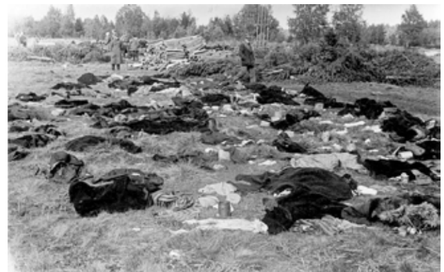
חיילי הצבא האדום בוחנים בגדי ההנרצחים ליד מקום הרצח Советские солдаты рассматривают одежду убитых, найденную на месте расстрела

עם ההגעה למחנה נלקח מהאסירים כל רכושם הפרטי. הם קיב-